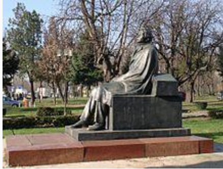
Statuia lui George Enescu, sculptată de Ion Jalea, instalată în 1971 pe peluza din fața Operei Naționale București

În anul 1932 devine membru titular al Academiei Române.