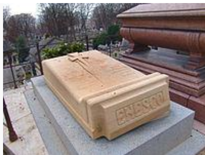
Mormântul lui George Enescu din Cimetière du Père Lachaise - Paris