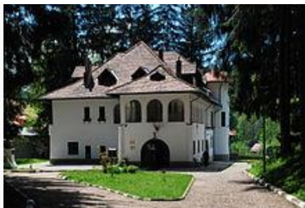
Casa memorială G. Enescu de la Cumpătu, Sinaia