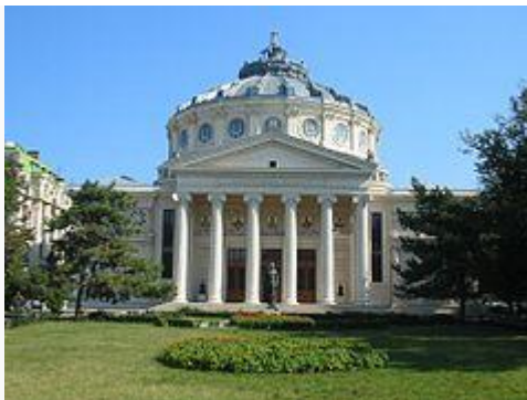
Ateneul Român, sediul Filarmonicii George Enescu

În timpul celui de Al doilea război mondial, rămas în București, a avut o activitate dirijorală bogată, încurajând și creațiile unor muzicieni români ca Mihail Jora, Constantin Silvestri, Ionel Perlea, Nicolae Brânzeu, Sabin Drăgoi. După război a dat concerte împreună cu David Oistrach, Lev Oborin, Emil Gilels și Yehudi Menuhin, care l-a vizitat la București și la Sinaia.